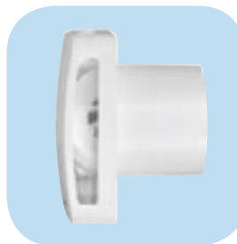
"Tihi elastični blokovi" sprečavaju prenos vibracija i buke