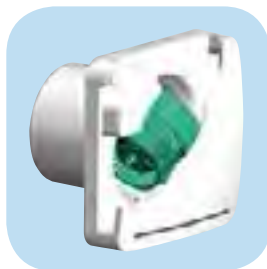
Ekstremno nizak nivo buke