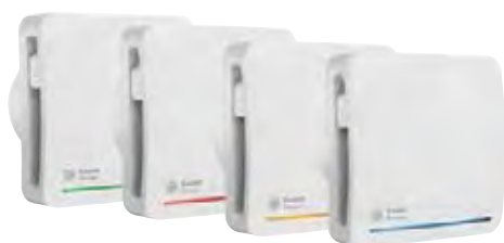
Različiti stilovi i boje

Različiti stilovi sa obojenim lajsnicama