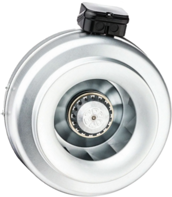
In-line centrifugalni ventilator